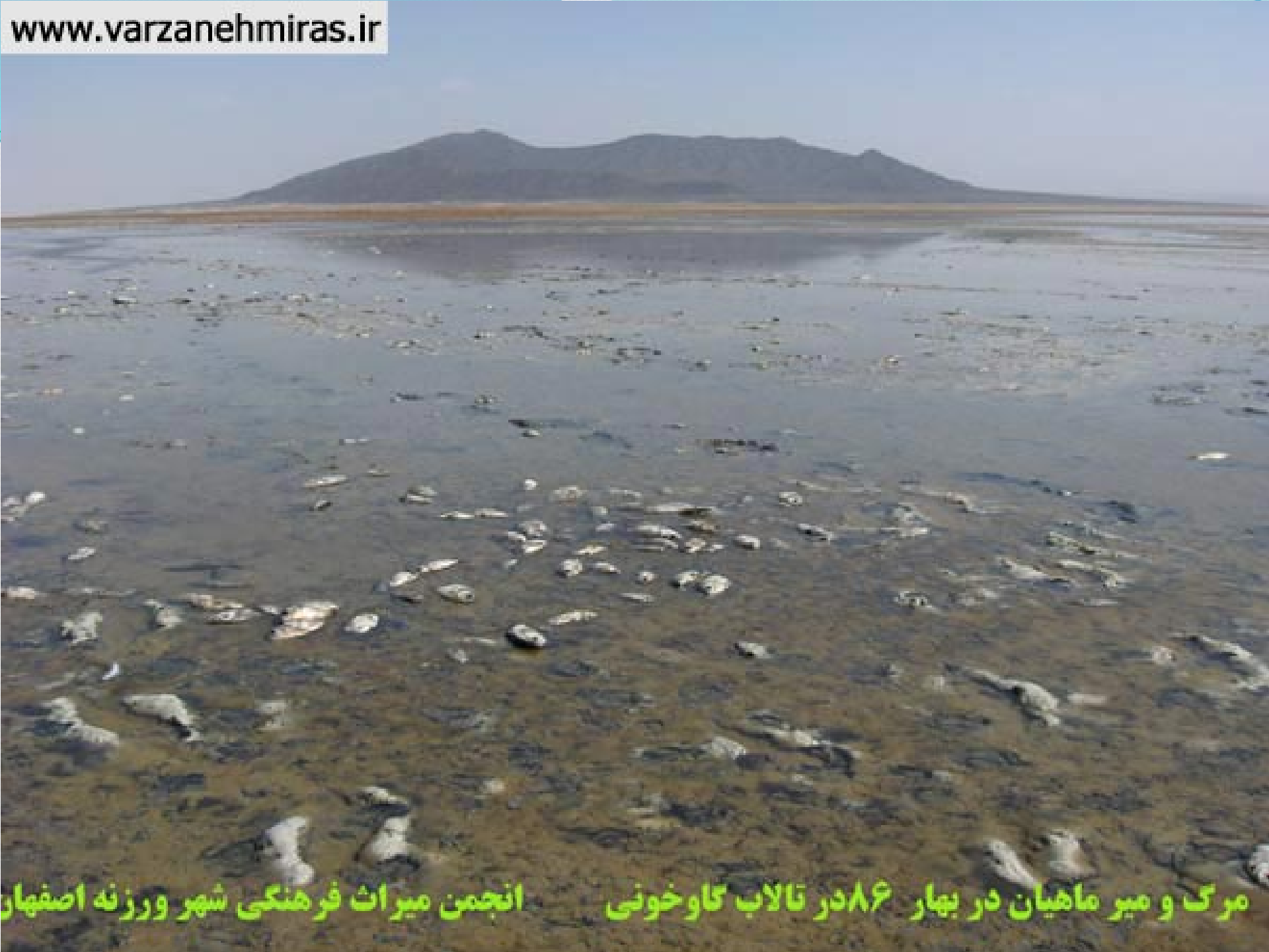
مرگ و میر ماهیان در بهار ۸۶ در تالاب گاوخونی انجمن میراث فرهنگی شهر ورزنه اصفهان