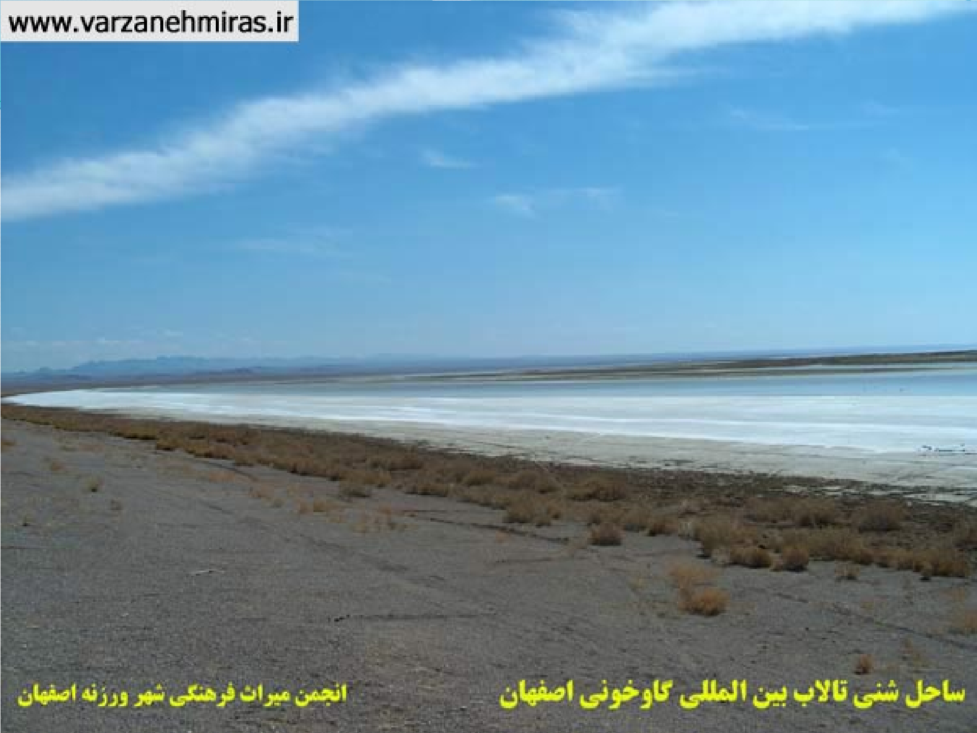
انجمن میراث فرهنگی شهر ورزنه اصفهان