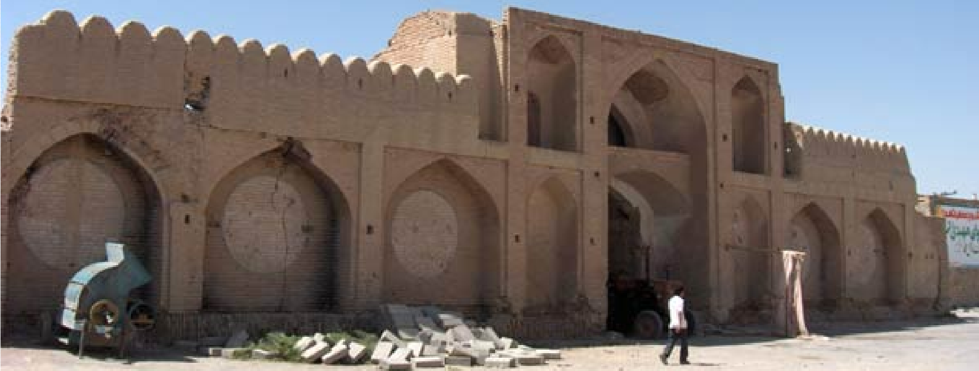
انجمن میراث فرهنگی شهر ورزانه