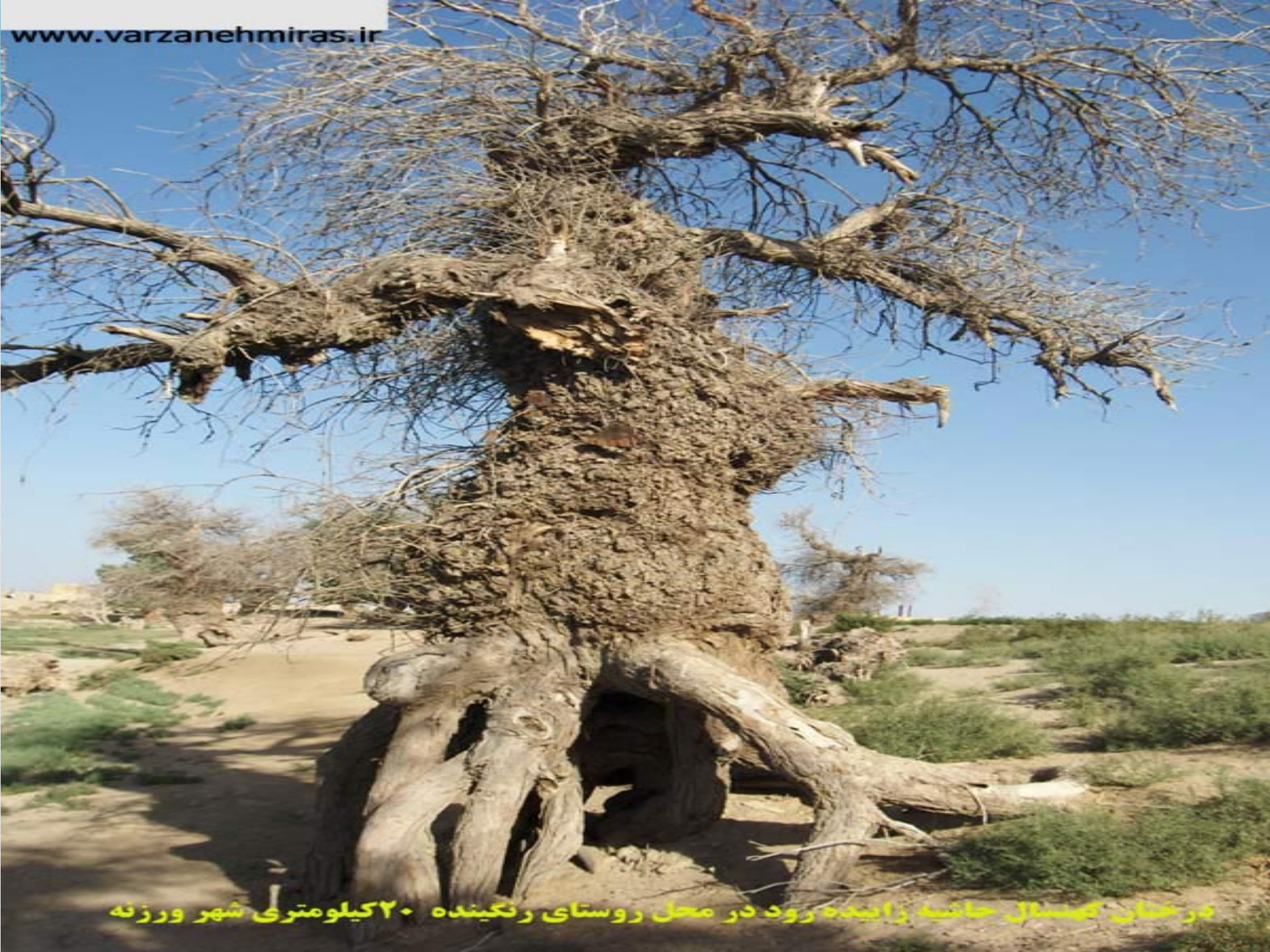
درختان کهنسال حاشیه زاینده رود در محل روستای رنگینده ۲۰ کیلومتری شهر ورزنه