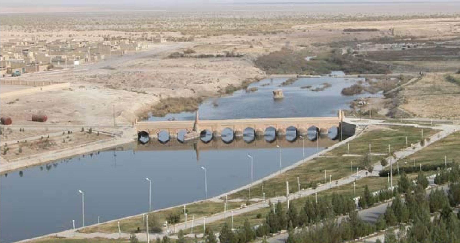
پل تاریخی ورزانه متعلق به عصر صفوی آخرین پل احدائی بر روی زاینده رود انجمن میراث فرهنگی ورزانه