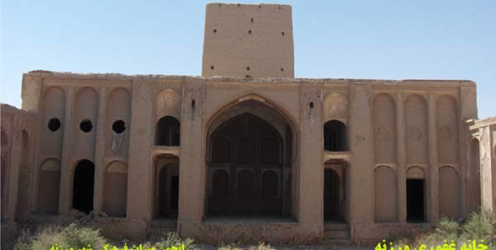
انجمن میراث فرهنگی شهر ورزانه